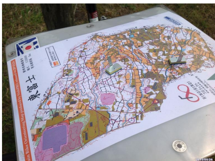
マウンテンバイクオリエンテーリング用地図 MTBIに地図専用ホルダーで装着